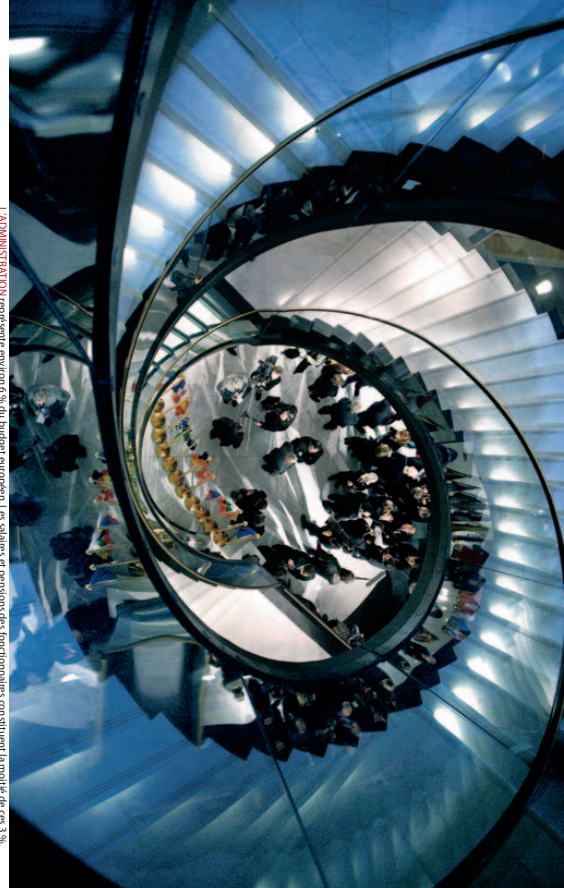
L'ADMINISTRATIF augmente d'environ 6% du budget européen. Les salaires et pensions des fonctionnaires, qui étaient la moitié de ceux de 2004.

Le fait est que les fonctionnaires européens ont obtenu une augmentation salariale de 1,7%... Mais comment l'appliquer à ce jour ?